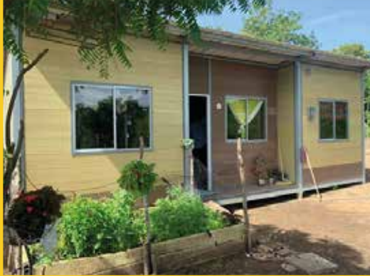
ENTREGA VIVIENDA DE BOLÍVAR-BOLÍVAR VIGENCIA 2019 II SEMESTRE 2021

Fiduagraria a través de su Unidad de Gestión, administra actualmente cuatro Patrimonios Autónomos de Vivienda de Interés Social Rural, mediante los cuales se ejecuta la política pública con la que se benefician miles de hogares rurales de bajos recursos que no cuentan con vivienda propia en zonas apartadas del país, con presencia en los 32 Departamentos del país.