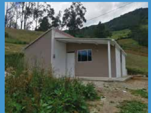
ENTREGA DE VIVIENDA VIGENCIA 2015 TÚQUERRES -NARIÑO

Igualmente, desde la Unidad de Gestión VISR, se realiza acompañamiento social, articulación institucional y procesos formativos con la población beneficiaria.